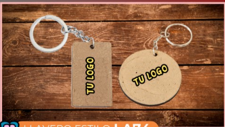
LLAVERO ESTILO LA74

Llavero plástico transparente acrílico, personalizado en ambos lados, con fotografías, dibujos y textos.