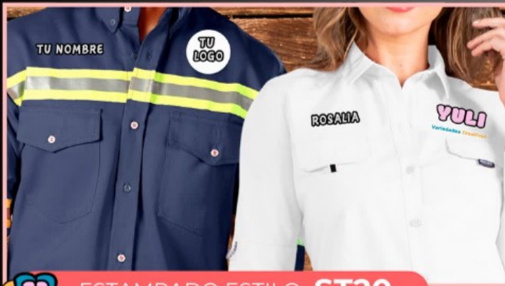
ESTAMPADO ESTILO ST20

Estampado personalizado en tu prenda con el nombre y logotipo, en vinil textil o DTF en tamaño de 8 cm x 8 cm o 7 cm x 9 cm.