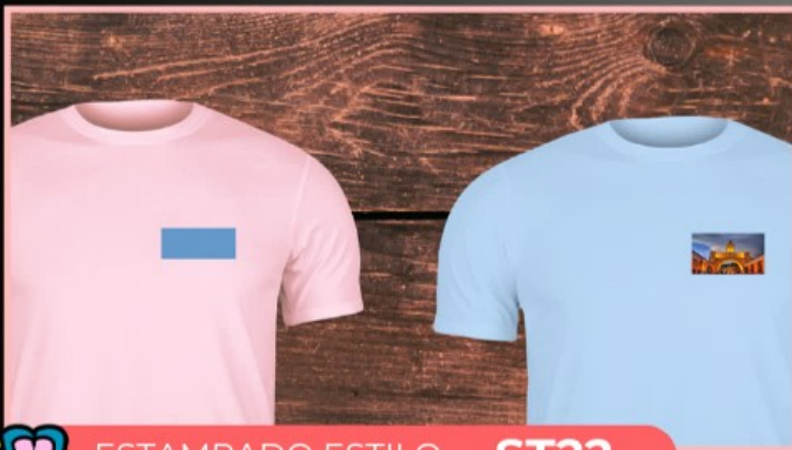
ESTAMPADO ESTILO ST22

Estampado personalizado en tu camisola, le colocamos el nombre y número, dependiendo el color de la tela, se puede personalizar con sublimación, DTF o vinil textil.