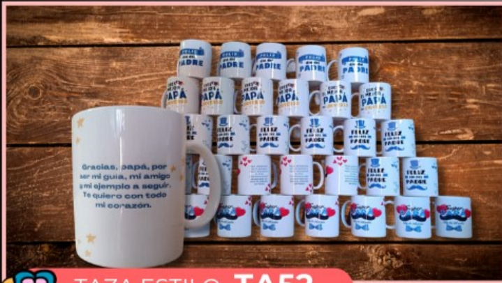
TAZA ESTILO TA52

Taza de 11 onzas personalizada con tu logotipo, texto o dibujo, no incluye fotografía y el fondo del diseño es blanco.