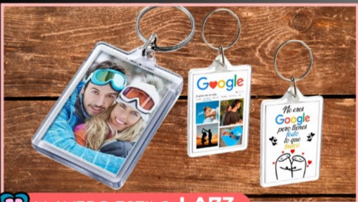
LLAVERO ESTILO LA73

Llavero metal estilo corta uñas y destapador personalizado con tu Logotipo o fotografía.