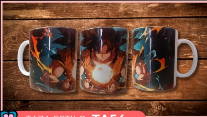
TAZA ESTILO TA54

Taza de 11 onzas personalizada con tu logotipo, texto o dibujo, no incluye fotografía y el fondo del diseño puede ser de un color.