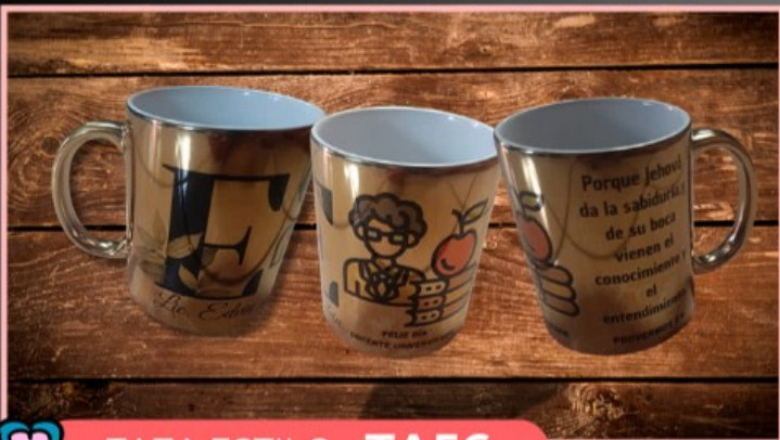
TAZA ESTILO TA56

Taza de 11 onzas, personalizada con fotografía, paisaje, logotipo, dibujo y texto, diseño multicolor.