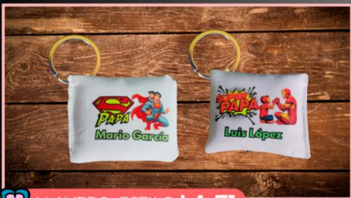
LLAVERO ESTILO LA 71

Llavero de metal galvanizado antioxidante, personalizado al frente con tu logotipo, dibujo, fotografía y texto.