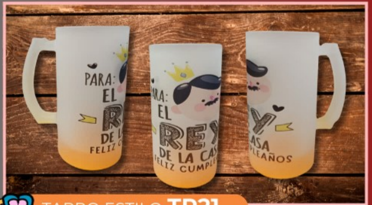
TARRO ESTILO TR21

Taza vidrio nevado de 11 onzas, personalizada con tu logotipo, dibujo y texto.