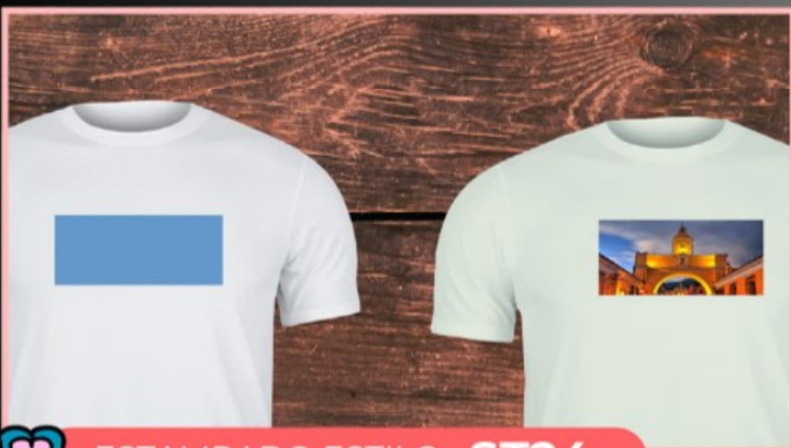
ESTAMPADO ESTILO ST24

Le colocamos texto, fotografía o dibujo a tu prenda, en cualquier tela o color, el tamaño del diseño es 8 cm x 8 cm, en sublimación, DTF o vinil textil.