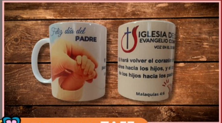
TAZA ESTILO TA53

Taza de 11 onzas personalizada con tu logotipo, texto o dibujo, no incluye fotografía y el fondo del diseño es blanco.