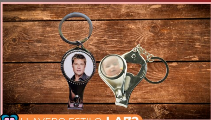
LLAVERO ESTILO LA72

Llavero tipo almohadita de tela blanca con esponja, personalizado con logotipo, dibujo o texto.