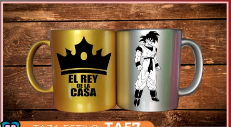
TAZA ESTILO TA57

Taza espejo dorado, plateado o rosa brillante de 11 onzas, personalizada con tu logotipo, texto y dibujo.