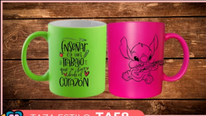
TAZA ESTILO TA58

Tazas color neón de 11 onzas personalizada con tu logotipo, imagen y texto.