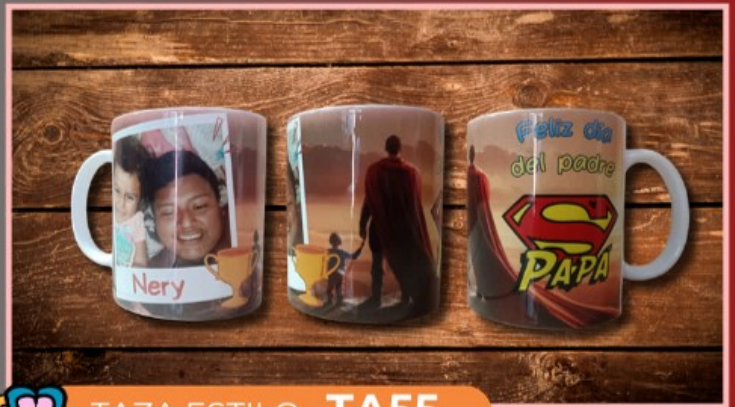
TAZA ESTILO TA55

Taza de 11 onzas personalizada con tu logotipo, dibujo o texto, el color del fondo del diseño puede ser multicolor, el diseño no incluye fotografía.