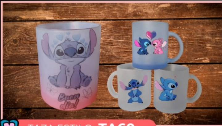
TAZA ESTILO TA60

Taza mágica (cambia de color y aparece el diseño con agua caliente) de 11 onzas, personalizada con tu logotipo, dibujo, fotografía y texto.