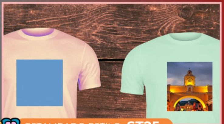
ESTAMPADO ESTILO ST25

Le colocamos texto, fotografía o dibujo a tu prenda, en cualquier tela o color, el tamaño del diseño es 20 cm x 14 cm, en sublimación, DTF o vinil textil.