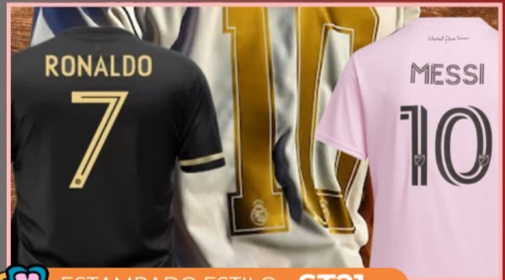
ESTAMPADO ESTILO ST21

Estampado personalizado en tu prenda con el nombre y logotipo, en vinil textil o DTF en tamaño de 8 cm x 8 cm o 7 cm x 9 cm.