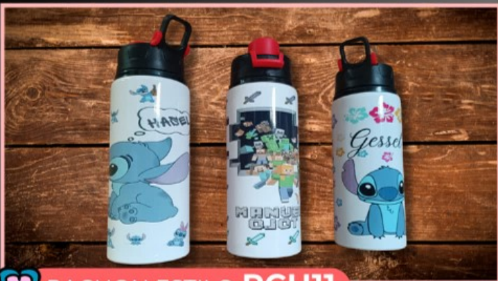
PACHON ESTILO PCH11

Tarro nevado de 16 onzas, personalizado con tu logotipo, dibujo o texto.