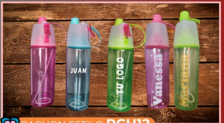
PACHON ESTILO PCH12

Pachón de aluminio de 600 ml, tapa rosca de plástico, personalizado con fotografías o cualquier tipo de diseño multicolor.