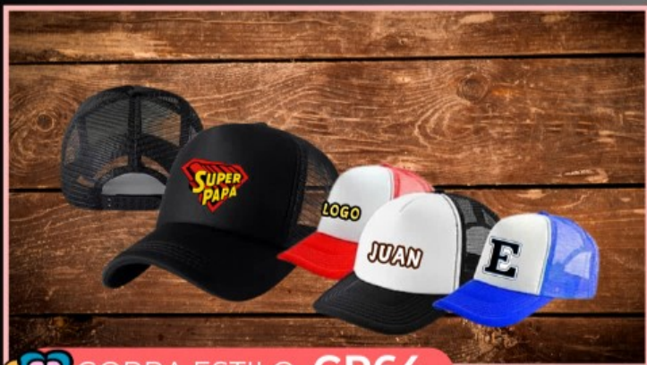
GORRA ESTILO GR64

Gorra tipo truck malla en diferentes colores personalizada con diseño en la frente.