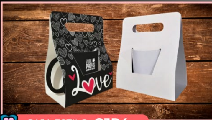
CAJA ESTILO CJP4

Caja de cartón cuadrada tamaño taza, lista para personalizar cualquier diseño multicolor.