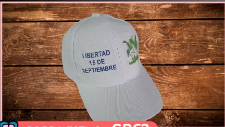
GORRA ESTILO GR62

Gorra lisa tipo acrílica en diferentes colores con un diseño en la frente.