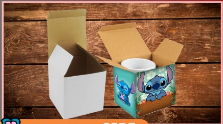
CAJA ESTILO CJP3

Vaso plástico de 11 onzas con tapadera y lentejuelas, personalizado con vinil adhesivo con texto o dibujo de uno a dos colores.