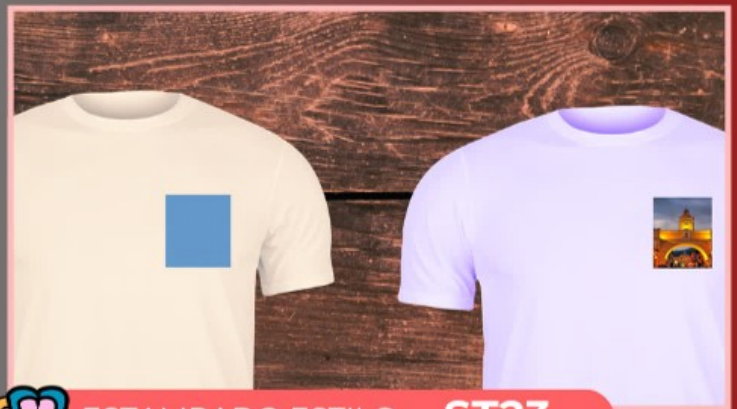
ESTAMPADO ESTILO ST23

Le colocamos texto, fotografía o dibujo a tu prenda, en cualquier tela o color, el tamaño del diseño es 4 cm x 7 cm, en sublimación, DTF o vinil textil.