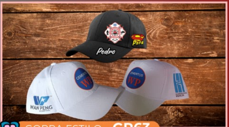
GORRA ESTILO GR63

Gorra lisa tipo acrílica en diferentes colores con dos diseños en la frente, pueden ser dos dibujos o dibujo y texto.