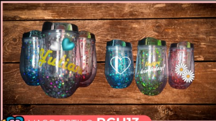
VASO ESTILO PCH13

Vaso plástico de 11 onzas con tapadera y lentejuelas, personalizado con vinil adhesivo con texto o dibujo de uno a dos colores.