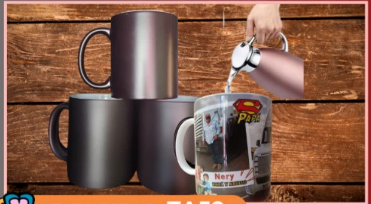
TAZA ESTILO TA59

Tazas color neón de 11 onzas personalizada con tu logotipo, imagen y texto.