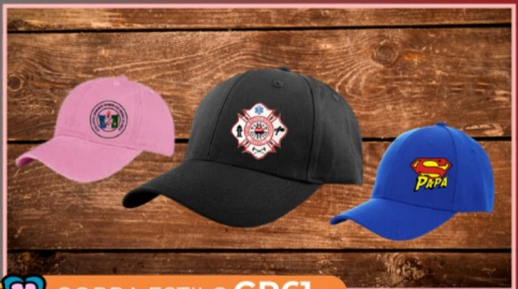
GORRA ESTILO GR61

Caja de cartón tipo bolsa para taza, lista para personalizar cualquier diseño multicolor.